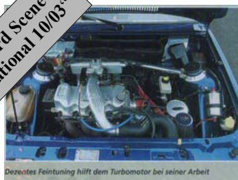
Dezentere Feintuning hilft dem Turbomotor bei seiner Arbeit

Auszug aus „Ford Scene Drive International 10/03“