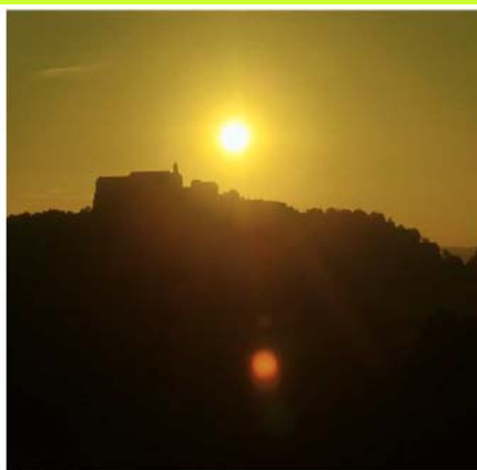
Kulturtourismus: Malerische Landschaft vielfältig und kleinstrukturiert.