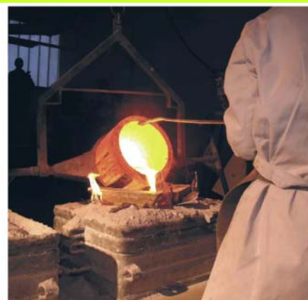
Handwerk: Über Jahrhunderte entwickelte sich die weithin geschätzte Handwerkskultur