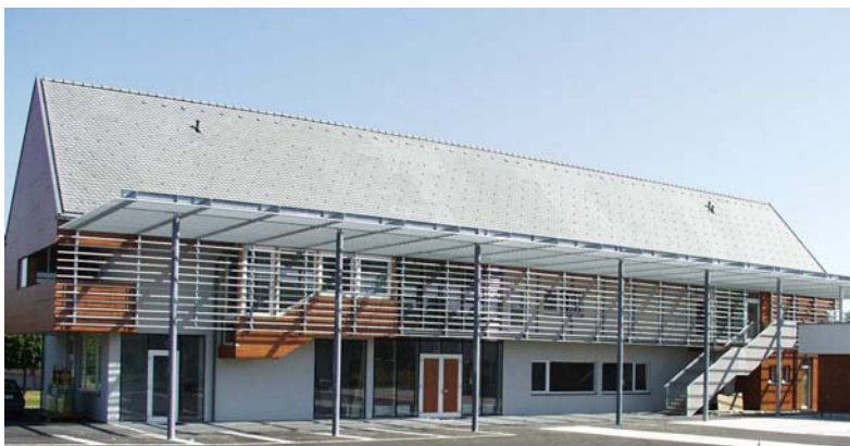
Das Gemeindezentrum Halbenrain