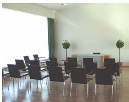
Das neue Standesamt