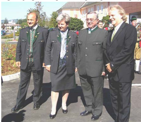
v.l.n.r.: LAbg Anton Gangl, Landeshauptmann Waltraud Klasnic, Bgm. Alois Domittner u. Architekt DI Baumeister Hans Walter Tanos vor der Eröffnung

Die Bauwerkskosten inkl. Nebengebäude haben sich auf ca. € 1,70 Mio. belaufen. Die Finanzierung erfolgte über eine Leasingvariante, welche mit der Hypo Steiermark Kommunal- und Gebäudeleasing GmbH abgeschlossen wurde.