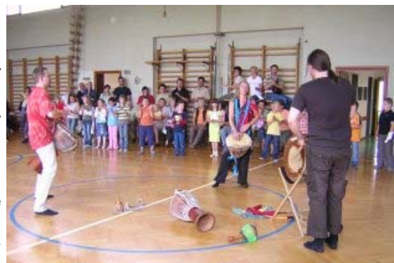
... beim gemeinsamen Schlusskonzert wurde getrommelt!

Ebenso danken wir unseren Sponsoren sehr herzlich für die großzügige finanzielle Unterstützung.