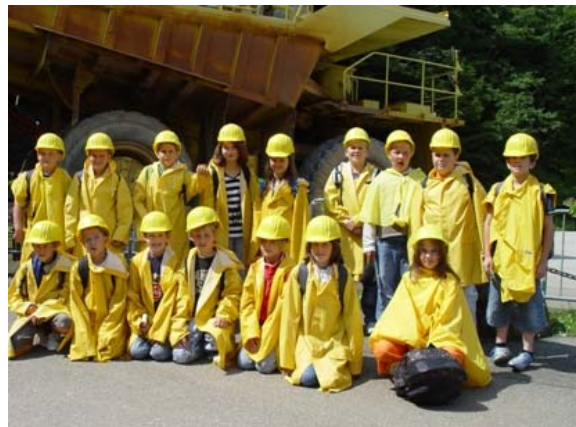
am steirischen Erzberg...

Trotz des anstrengenden Programms waren unsere Schüler nie zu müde um noch Fußball oder Tischtennis zu spielen, oder sich bei einem Gesellschaftsspiel im Zimmer zu vergnügen.