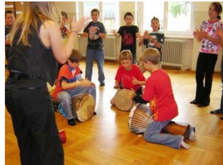
Bei den Workshops und ...