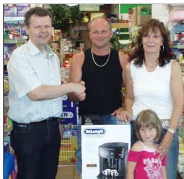
Familie Pfleger bei der Übernahme des Preises

Montag, 02. Juli 2007 von 10 - 12 Uhr und von 16 bis 18 Uhr