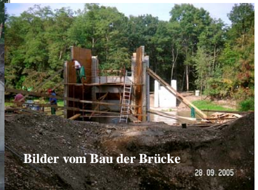
Bilder vom Bau der Brücke