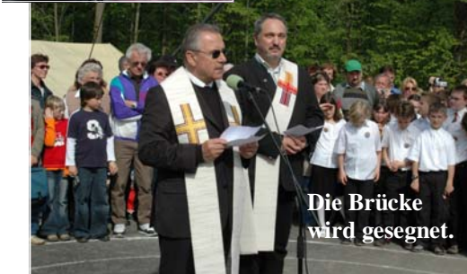
Die Brücke wird gesegnet.