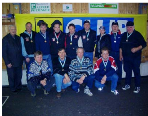
B-Finale: Mannschaften von Long Life, Gasthaus Salber und Post.

Voranzeige: Am 20. Mai 2004 (Christi Himmelfahrt) findet auf dem Gelände der Stocksportanlage ein Frühschoppen "40- Jahre ESV Halbenrain" statt.