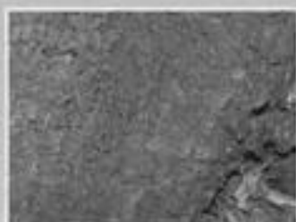
Bohrmehlansammlung in Rindenritzen