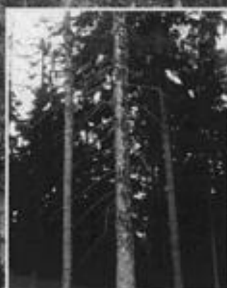
Rindenabfall bei befallenen Bäumen