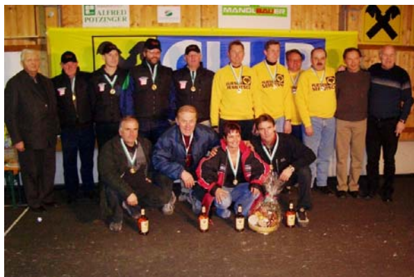
A-Finale: Mannschaften der Dorfgemeinschaft Pfarrsdorf, Fliesen Semlitsch und Klingbachhütte.