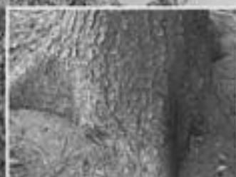
Nadelfall und Bohrmehl am Stammfuß