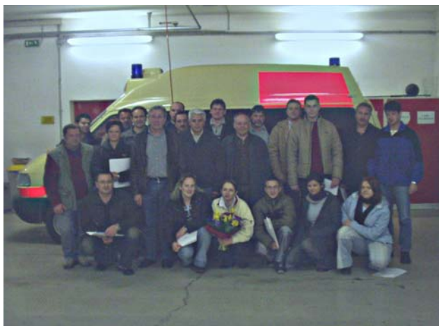
Abschlussfoto Erste Hilfe Kurs der FF-Oberpurkla 2004

Schon seit einigen Jahren wird am Anfang eines Jahres ein Erste Hilfekurs in Oberpurkla durchgeführt.