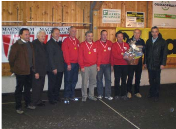
Sieger im A-Finale: Mineralwasser Long Life