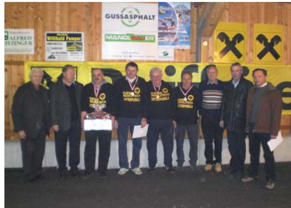
Sieger im B-Finale: Fliesen Semlitsch, Unterpurkla