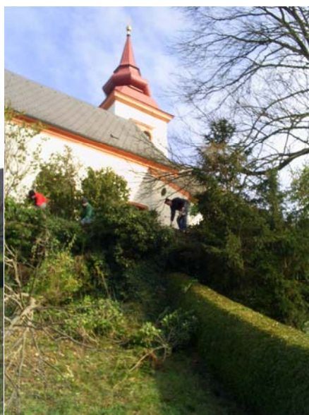
Intensive Rodungsarbeiten waren notwendig