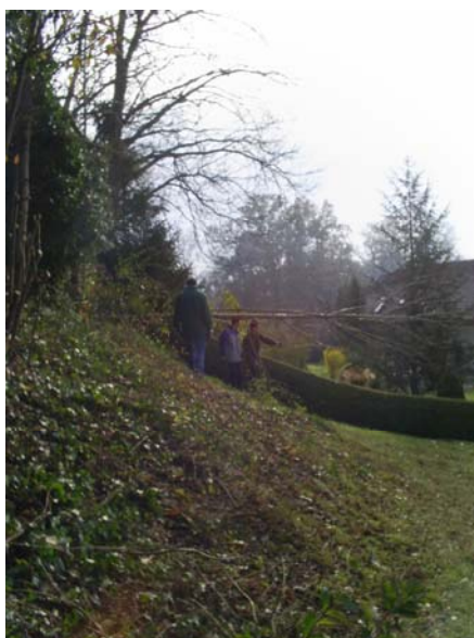
Bei der Lagebesprechung

Dennoch fanden wir es eine gute Idee, den Kirchenaufgang neu zu gestalten und wurden nach kurzer Rücksprache mit unserer Gemeinde aktiv. Insgesamt hatten wir 3 Samstage (4., 11. und 18. November) benötigt um die Böschung neu zu gestalten und im Durchschnitt waren ca. 15 Personen pro Tag anwesend.