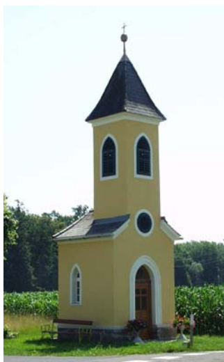
„Zimmermannkapelle“ in Oberpurkla

Die „Zimmermannkapelle“ in Oberpurkla erstrahlt nach der Instandsetzung wieder in neuem Glanz. Die Marktgemeinde Halbenrain hat für die Sanierung der Außenfassade, Dach, Balken u. Eingangstür ca. € 8.500,00 Euro aufgewendet.