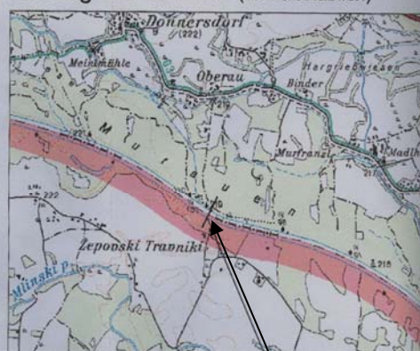
Standort der Brücke Hängebrücke